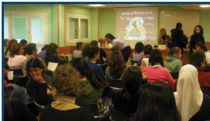
Jornadas: “Igualdad y no Discriminación” (2009): Participantes en el acto: Ponentes y Alumnos.

Teniendo este objetivo como referente, el Grupo ICSE lleva 30 años realizando acciones formativas relacionadas con una amplia y diversificada temática, dirigida a nuevos colectivos profesionales. Titulados universitarios o con estudios medios o primarios, trabajadores y desempleados, funcionarios y opositores, pueden encontrar en la Organización ICSE una respuesta de calidad adecuada a sus necesidades de formación o conocimiento.