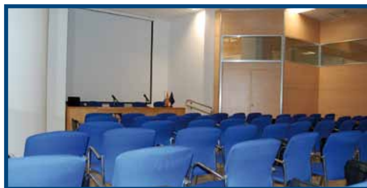
Salón de Actos. ICSE Tenerife (2010)