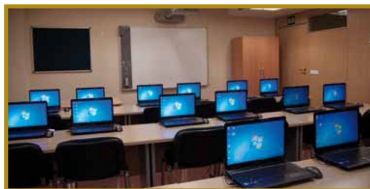
Aula de Informática (2010)