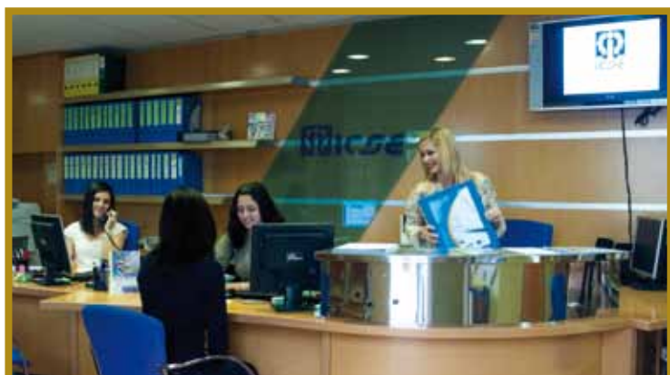
Recepción de ICSE. Gran Canaria (2010)