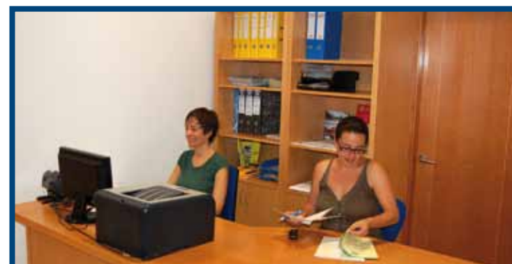
Secretaría de ICSE. Tenerife (2010)