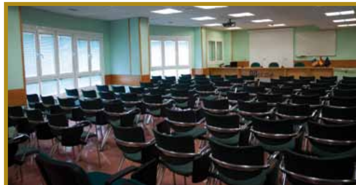
Salón de Actos. ICSE Gran Canaria (2010)