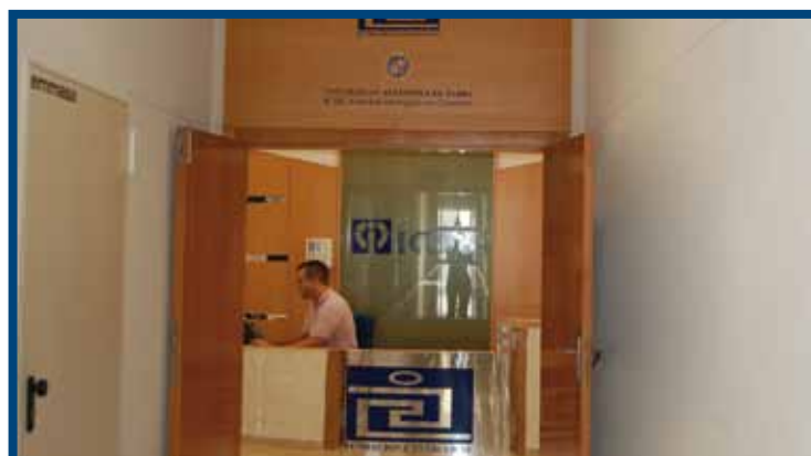
Recepción de ICSE. Tenerife (2010)