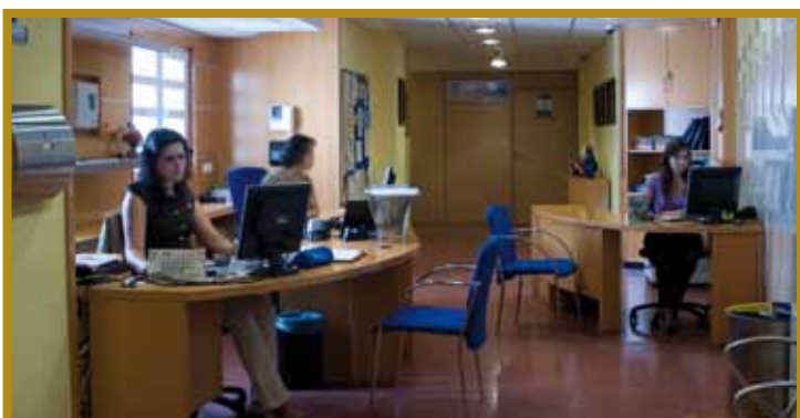
Secretaría de ICSE. Gran Canaria (2010)