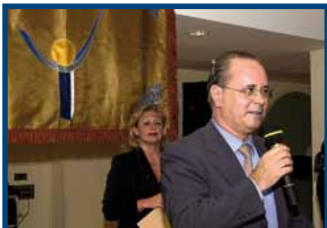
El Director de ICSE agradeciendo el premio otorgado por el Colegio de Psicólogos, junto a la Decana del Colegio. (2002)

Miembro del Consejo Asesor de la Consejería de Educación, Cultura y Deportes, (1983).