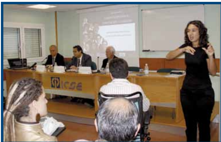
Jornadas: “Formación y Empleo Accesible y Normalizado” (2009): El Presidente de ICSE con el Consejero de Empleo, Industria y Comercio, el Presidente del Consejo Económico y Social de Canarias y la Intérprete en L.S.E..

La Organización ICSE, desde el primer año de su creación (1979), tomó como objetivo inicial el desarrollo de la Psicología Aplicada a los campos de la clínica, de la educación y de la empresa y como Centro de Formación del profesorado. A principios de los 80, ICSE era prácticamente la única Institución canaria que organizaba para los docentes cursos, jornadas o conferencias, sobre temas de innovación educativa.