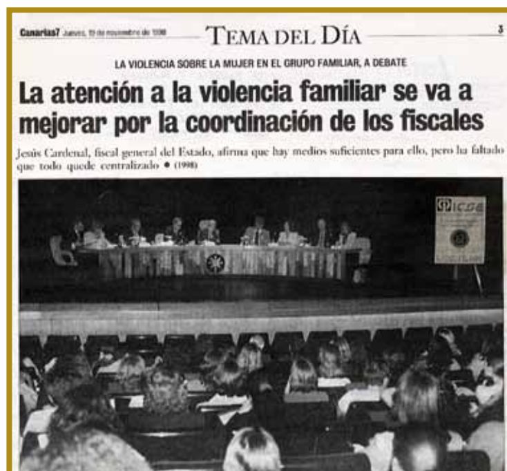
El Fiscal General del Estado, D. Jesús Cardenal imparte la Conferencia Inaugural de las Jornadas sobre "la Mujer en el Grupo Familiar". (Noticia que recoge el periódico Canarias7, de 19 de Noviembre de 1998)