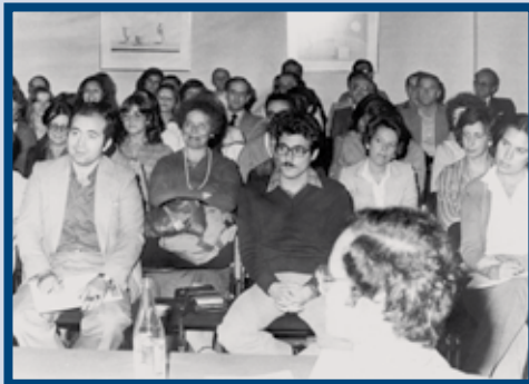
Jornadas: Psicología Aplicada a la Empresa (1980).