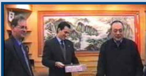
Encuentro Internacional en China. (2000)