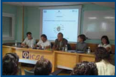
Jornadas: "Integración del Inmigrante" (2008)