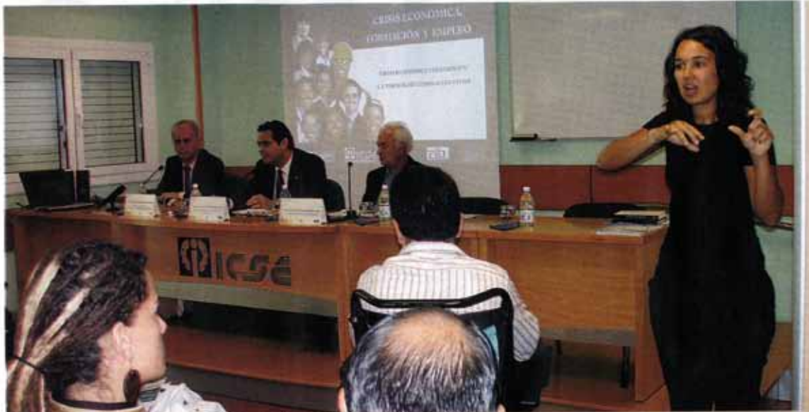
Un momento de las jornadas organizadas por el ICSE.