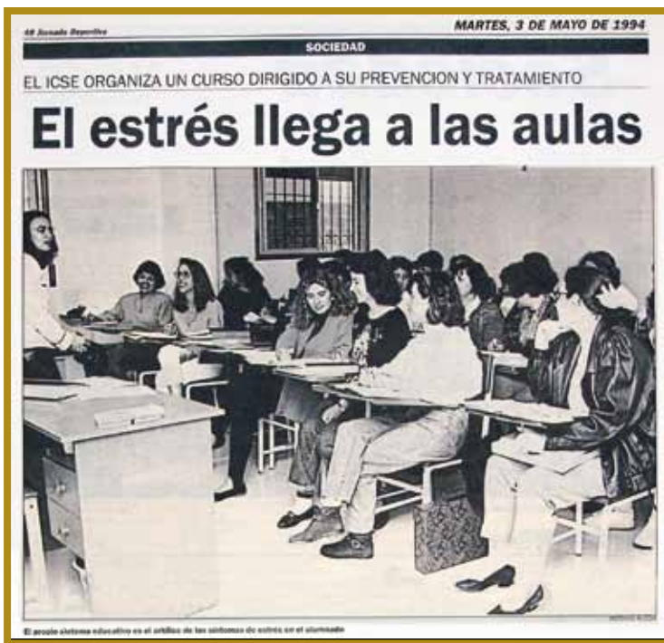
Curso: "Prevención y Tratamiento del Estrés" (Noticia aparecida en Jornada Deportiva, el 3 de Mayo 1994.)