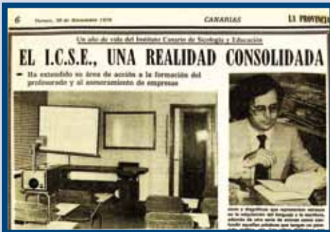
Reportaje, "La Provincia", haciendo balance de ICSE del curso (1979-1980).

Viaje a China del Presidente de ICSE, junto con el Consejero de Educación del Gobierno de Canarias y el Director General de Universidades, para apoyar el programa del curso de español para alumnos chinos.