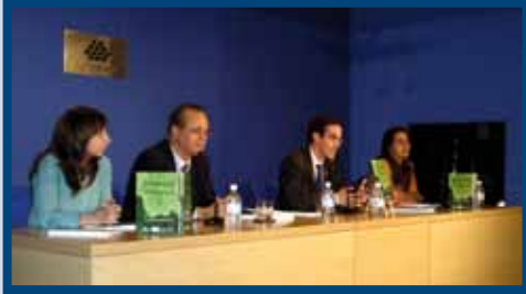
Presentación "Estudio Medioambiental" (2006)