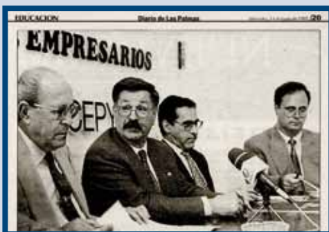
Presentación de la UAX en Canarias (1995).