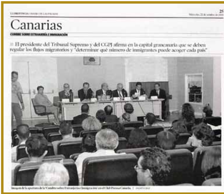
El Presidente del Tribunal Supremo abre la "Cumbre Internacional de Extranjería" organizada por ICSE. (Eco de Prensa: "La Provincia", 22 de octubre de 2003)