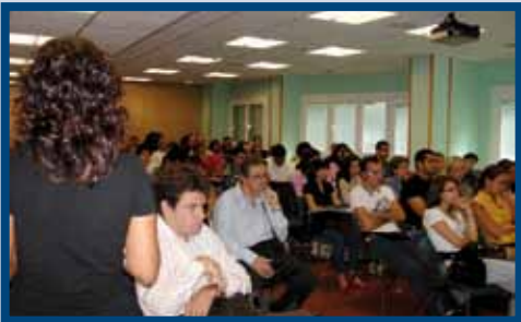
Jornadas: "Igualdad y NO Discriminación" (2009)