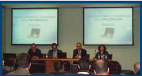
Jornadas sobre: "Seguridad de la Información ISO 27.001" (2010)