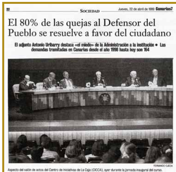
Curso de "Derecho Administrativo". Participan: