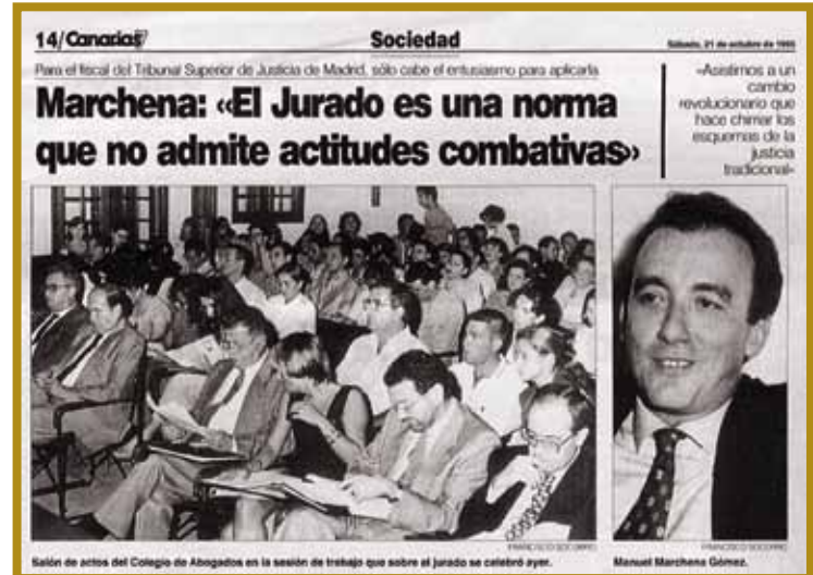
Conferencia del Magistrado Manuel Marchena en las "Jornadas sobre el Tribunal del Jurado". (Noticia ofrecida en Prensa, Canarias7, el 21 de Octubre de 1995)