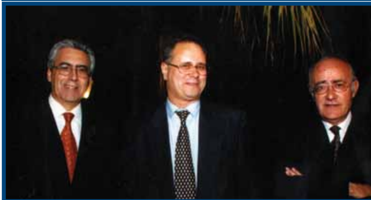
El Presidente de ICSE con: - D. Pedro Cruz Villalón, Presidente del Tribunal Constitucional , y - D. Javier Delgado Barrio, Presidente del Tribunal Supremo y del Consejo General del Poder Judicial .