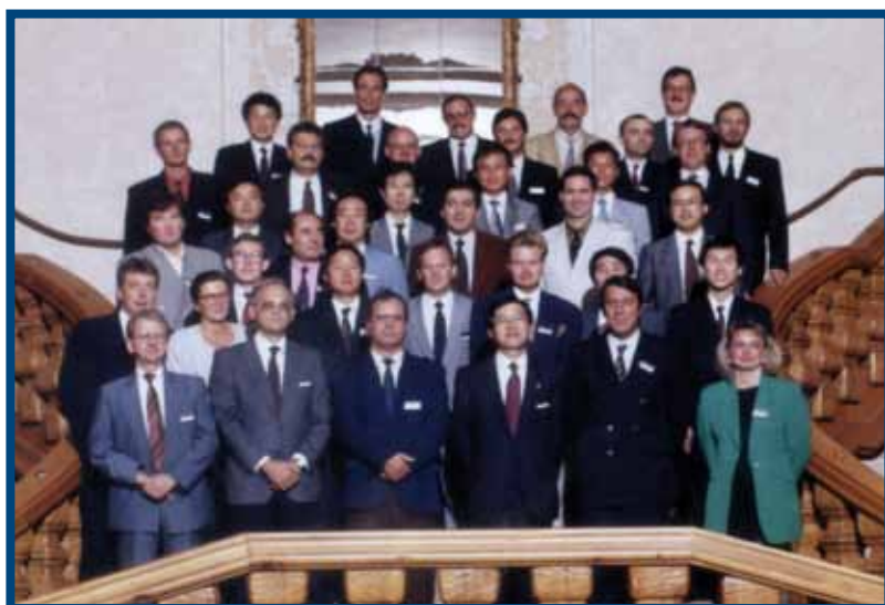
Directivos, Proveedores y Delegados de SAMSUNG en Austria. (El Director de ICSE en 1ª fila, 3º Izquierda) .

ICSE acudió a este encuentro internacional, celebrado el año 1990 en Innsbruck (Austria), dónde se daban cita los empresarios y profesionales de informática de todos los países del mundo invitados por la multinacional Samsung. Nuestro centro acudía a este evento ya que había sido nombrado su representante oficial para Canarias con independencia del resto de España, lo que le permitió desarrollar su propia política comercial y de comunicación y disponer de tecnología informática totalmente actualizada. Esta incorporación empresarial generó la asistencia a Congresos y diferentes Ferias y Exposiciones sobre Nuevas Tecnologías en varios países europeos y asiáticos.