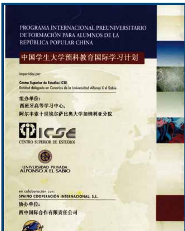
Portada del Folleto del Programa de Formación para alumnos chinos.

En el año 2000 ICSE tomó la iniciativa de realizar un Programa Internacional Pre-Universitario de Formación para alumnos de la República Popular China de enseñanza de la lengua española y su cultura. Para ello, contó con el apoyo de la Consejería de Educación del Gobierno de Canarias. En el año 2000, el Presidente del Grupo ICSE, junto con el Consejero de Educación del Gobierno de Canarias y el Director General de Universidades, realizaron un viaje a la República Popular China, con el propósito de apoyar este Programa.