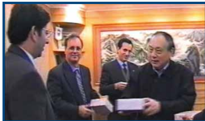
El Presidente de ICSE con el Subsecretario del Ministerio de Trabajo y Seguridad Social de la R. P. China, el Consejero de Educación del Gobierno de Canarias y el Director General de Universidades. Encuentro en China para el Programa Internacional de ICSE de Español para extranjeros (año 2000).