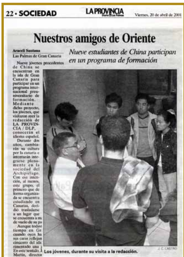
Eco de Prensa que recoge como noticia la realización del Programa ICSE de Español para alumnos de China. (La Provincia, 20 de abril de 2001)

Esta acción se benefició de la ayuda de la Consejería de Educación, que facilitó recursos para ponerlos a disposición de los alumnos y, así, proporcionarles una formación de calidad y contribuir a su integración cultural y lingüística en nuestro entorno hispano y occidental.